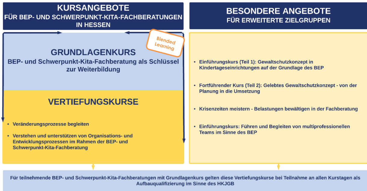
Abbildung 1: Kursangebot für BEP- und Schwerpunkt-Kita-Fachberatungen sowie weitere Zielgruppen der Management- und Steuerungsebene seit 01.01.2026