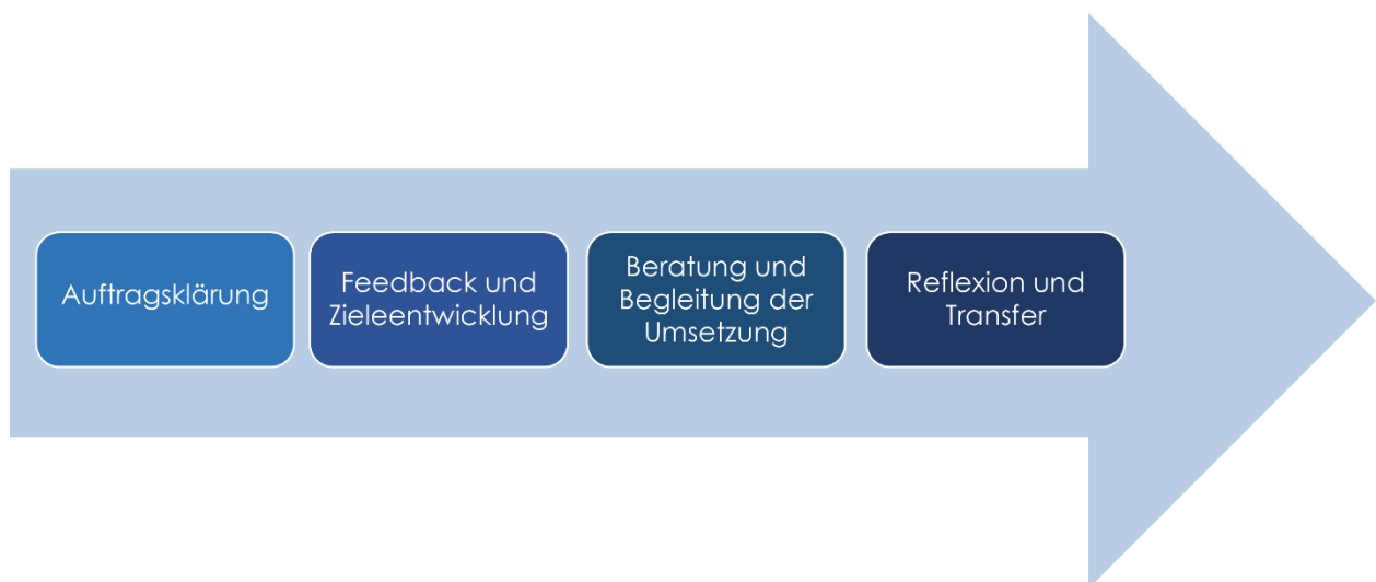
Abbildung 2: Modell der prozesshaften Beratung der BEP- und/oder Schwerpunkt-Kita-Fachberatung

Der Kurs baut auf bereits vorhandene Beratungs- und Methodenkenntnisse auf und versetzt die teilnehmenden Fachberatungen in die Lage, die Einrichtungen im Sinne der BEP-Fachberatung und Schwerpunkt-Kita-Fachberatung prozesshaft zu begleiten und zu beraten. Die Kursteilnehmenden erwerben vertiefte BEP-Kenntnisse – insbesondere in der Beobachtung und Reflexion der praktischen Umsetzung des BEP im Kita-Alltag. Auch die Arbeit der Schwerpunkt-Kita-Fachberatung wird im Kurs in den Blick genommen. Zudem lernen die Kursteilnehmenden das Prozessmodell der Fachberatung (siehe Abbildung 2) sowie Materialien und Methoden kennen, um die einzelnen Schritte der zu beratenden Einrichtung sinnvoll zu unterstützen. Als wichtige Voraussetzung dafür reflektieren die Kursteilnehmenden ihre Rolle und mögliche Rollenkonflikte, um diesen entgegenzuwirken.